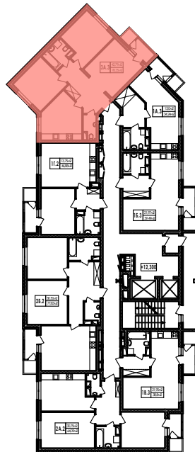
Схема розташування квартири 3А.3 на поверсі